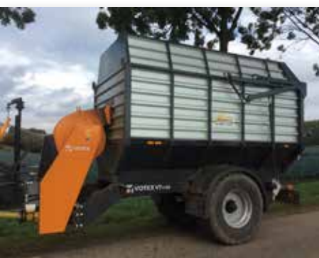
Remorques aspiratrices VT850